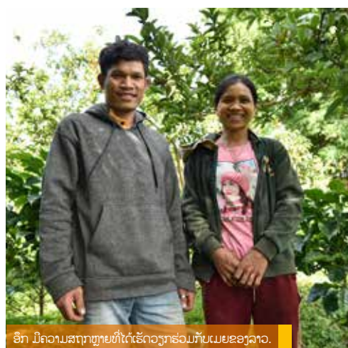
ອີກ ມີຄວາມສຸກຫຼາຍທີ່ໄດ້ເຮັດວຽກຮ່ວມກັບເມຍຂອງລາວ.

“ແຕ່ກ່ອນຂ້ອຍ ບໍ່ຮູ້ວ່າຈະຕ້ອງຂາຍກາເຟແນວໃດ ໃຜມາຊື້ກາເຟ ຂ້ອຍກໍຂາຍໄປໃນລາຄາທີ່ຖືກ. ຫຼັງຈາກທີ່ຂ້ອຍໄດ້ເຂົ້າຮ່ວມ ກິດຈະກຳຂອງໂຄງການ ເຮັດໃຫ້ຂ້ອຍໄດ້ຮູ້ກ່ຽວກັບເຕັກນິກ ການກຳເບ້ຍກາເຟ, ການປູກກາເຟ ແລະ ການແປຮູບກາເຟ. ນອກຈາກນັ້ນ, ຂ້ອຍກໍຍັງໄດ້ຮຽນຮູ້ກ່ຽວກັບບົດບາດທາງເພດ ເຊິ່ງມັນໄດ້ຊ່ວຍໃຫ້ຂ້ອຍໄດ້ຕັດສິນໃຈໃນການຂາຍກາເຟຮ່ວມ ກັບເມຍຫຼາຍຂຶ້ນ.”